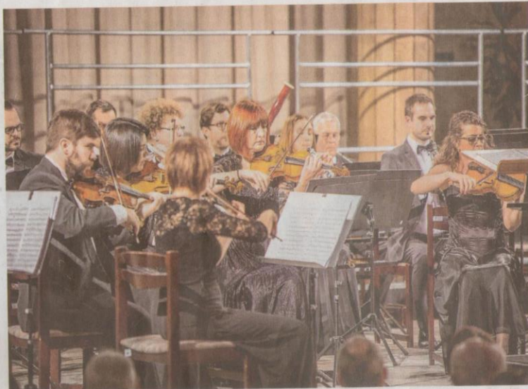
A Mendelssohn Kamarazenekar Beethoven Egmont-nyitányát adta elő